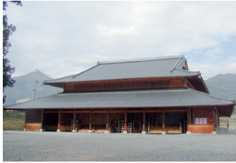
黒田人形浄瑠璃伝承館

竹田扇之助記念国際系操り人形館と、「伝統人形芝居」の会場となる黒田人形浄瑠璃伝承館を巡回します。