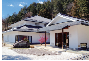
竹田扇之助記念国際系操り人形館